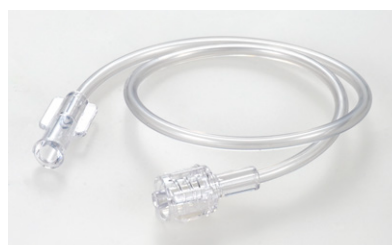
■ オスルアはローテータタイプ