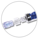
専用シリンジと接続部の拡大図