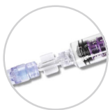
専用シリンジと接続部の拡大図