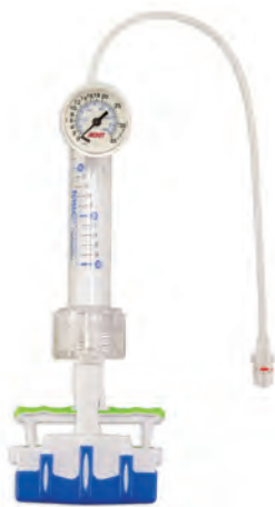
basixTOUCH™ 35 atm 対応 アナログ