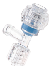
FLO40™ 50 mmショートボディ