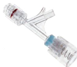
PhD™ バネ式の プッシュ&ホールド機構