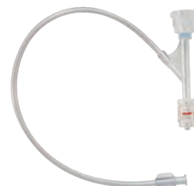
AccessPLUS™ エクステンションチューブ付 (500 psi)