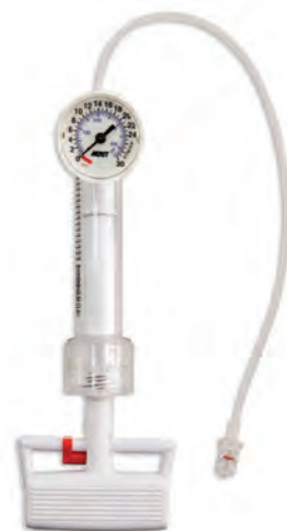
basixCOMPAK™ 30 atm 対応 アナログ