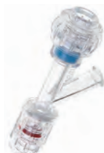
FLO50™ 60 mmショートボディ