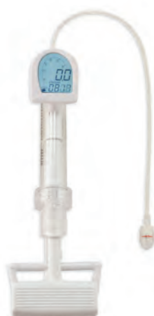
BLUE DIAMOND™ 30 atm 対応 デジタル